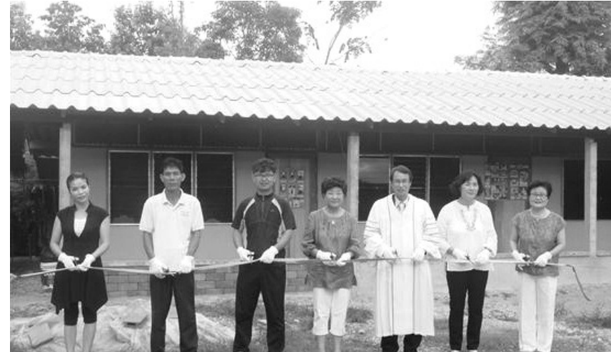
주로 복음을 들고 믿음으로 나아가서 경외의 거룩함이 들어나길 소원해 본 하나님 사랑과 이웃 사랑이 실제적으로 체험되어지는 풍성한 은혜로 눈이 열리고 말씀이 없이는 하나님을 기쁘시게 못할 또한 늘 세상 끝날까지 선한 싸움으로 복음의 찬양으로 하나님을 높이는 기사,사진 조미화 전도사